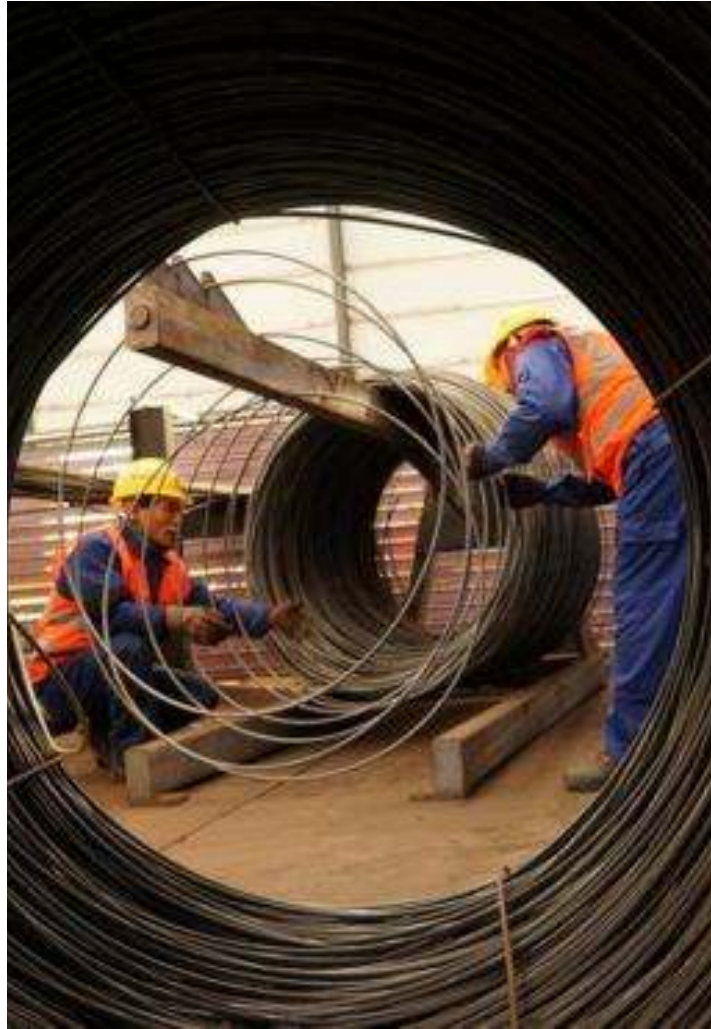
Sản phẩm thép cuộn/thép dây nhập khẩu (Ảnh minh họa)

N gày 26 tháng 7 năm 2018, Bộ Công Thương đã ban hành Quyết định số 2622/QĐ-BCT về việc điều tra áp dụng biện pháp chống lẩn tránh biện pháp tự vệ đối với sản phẩm thép cuộn/thép dây có mã HS: 7213.91.90; 7213.99.90; 7217.10.10; 7217.10.29; 7229.90.99; 9839.10.00; 9839.20.00 nhập khẩu vào Việt Nam (AC01.SG04).