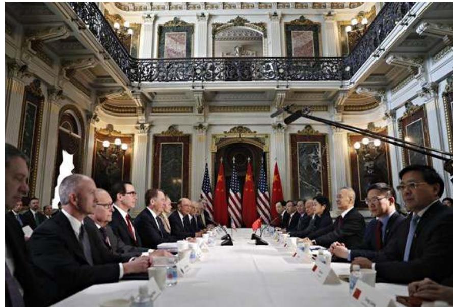
Đàm phán thương mại Mỹ - Trung (Hình ảnh minh họa)

Trung Quốc đã đưa ra một số đề xuất nhằm giải quyết các vấn đề trọng tâm liên quan đến việc mất cân bằng trong thương mại. Điều này sẽ loại bỏ một cách hoàn toàn hiện tượng thặng dư trong thương mại song phương với Hoa Kỳ trong 6 năm qua. Lượng thặng dư thương mại này đạt mức 380 tỷ đôla trong năm 2018, và có thể sẽ vượt mức 500 tỷ đôla vào năm 2024, điều này có thể sẽ có một tác động lớn đến dòng chảy thương mại toàn cầu và tổng sản phẩm quốc nội thế giới.