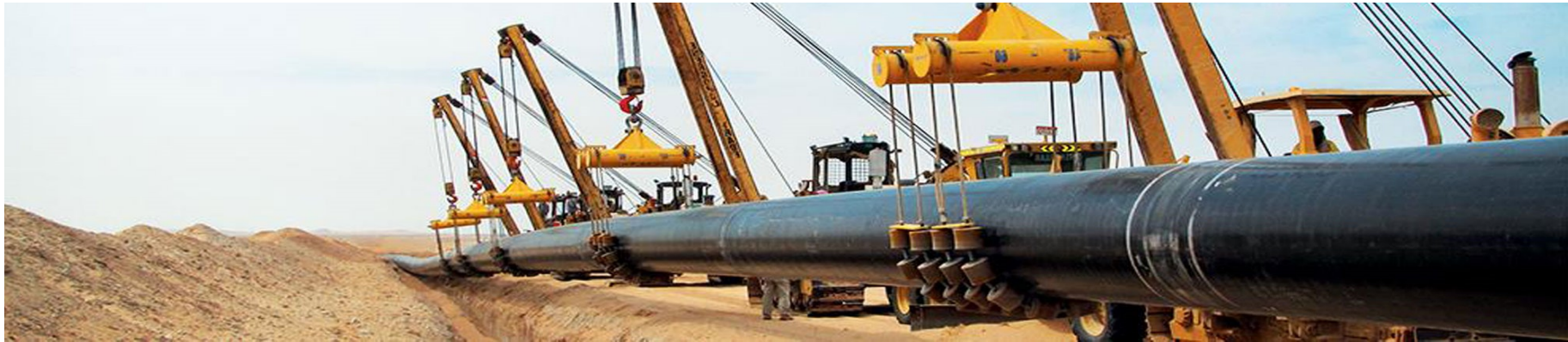
Một số sản phẩm ống thép hàn các bon (CWP- carbon steel welded pipe) (Ảnh minh họa)

CBSA cũng cho biết cơ quan có thẩm quyền sẽ tiếp tục điều tra về vấn đề thiệt hại của ngành sản xuất trong nước. Trong trường hợp kết luận tồn tại thiệt hại, Ca-na-đa sẽ ban hành lệnh áp thuế vào 15 tháng 2 năm 2019.