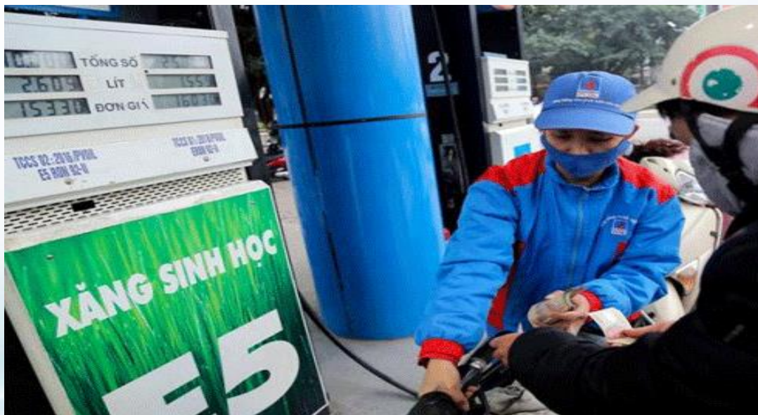
Một cửa hàng kinh doanh xăng E5 trên địa bàn tỉnh Cà Mau

Tham dự hội nghị có đại diện lãnh đạo Chi cục Tiêu chuẩn Đo lường Chất lượng Cà Mau; Trưởng phòng điểm TBT Cà Mau; Ban lãnh đạo Công ty xăng dầu Cà Mau; Đài phát thanh và truyền hình Cà Mau cùng đại diện của các cửa hàng kinh doanh xăng dầu thuộc Công ty xăng dầu Cà Mau với số lượng 160 đại biểu tham dự.