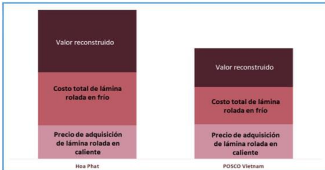
Gráfica 1. Comparativo de costos de lámina rolada en caliente y lámina rolada en frío